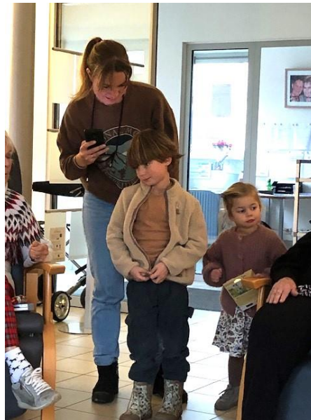
Een uitstapje naar Van Uytsel, de mooie kerstdecoratie bekijken en daarna tasje thee met een stukje taart. Een leuke uitstap.